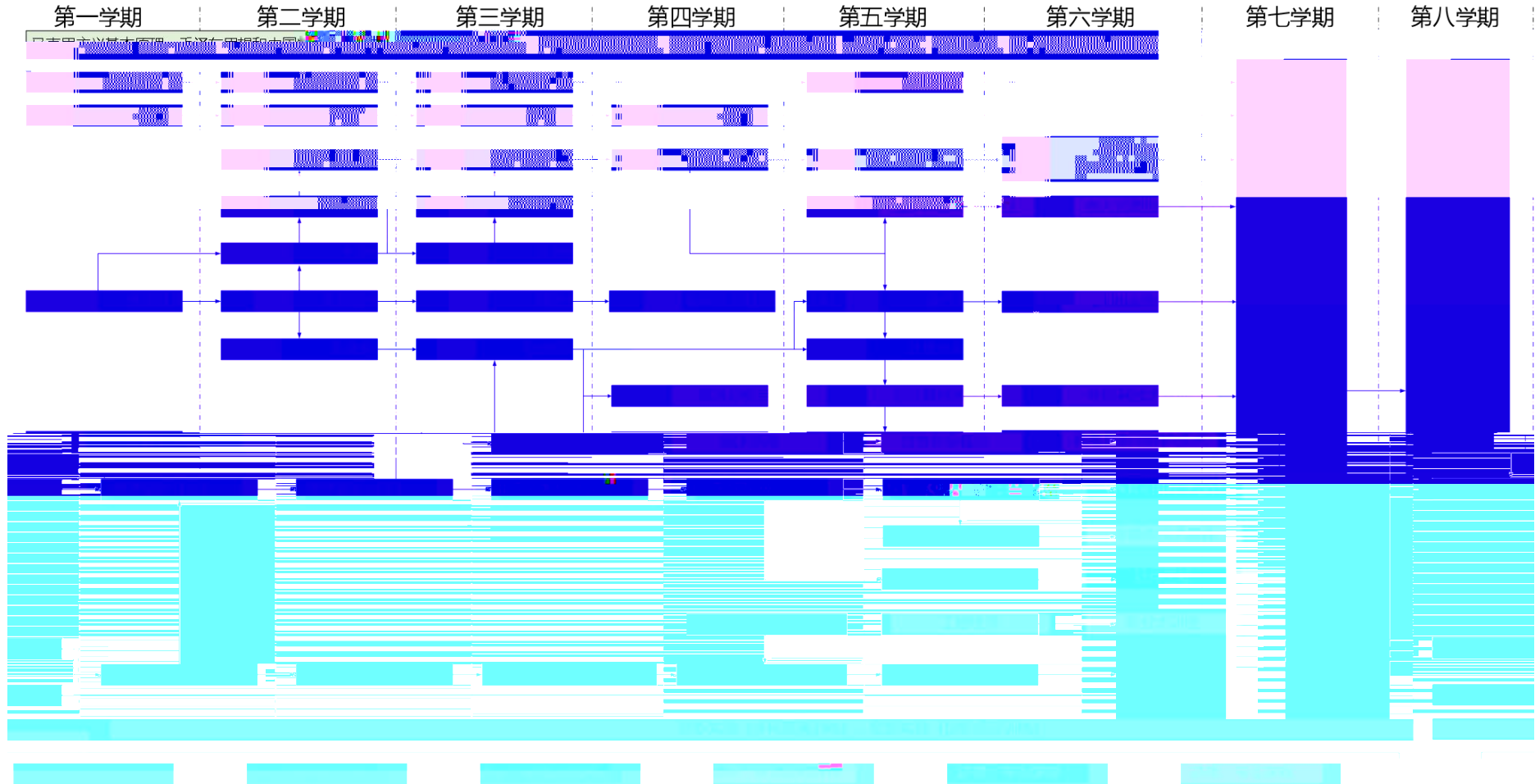
计算机科学与技术2019级人才培养方案课程关系图